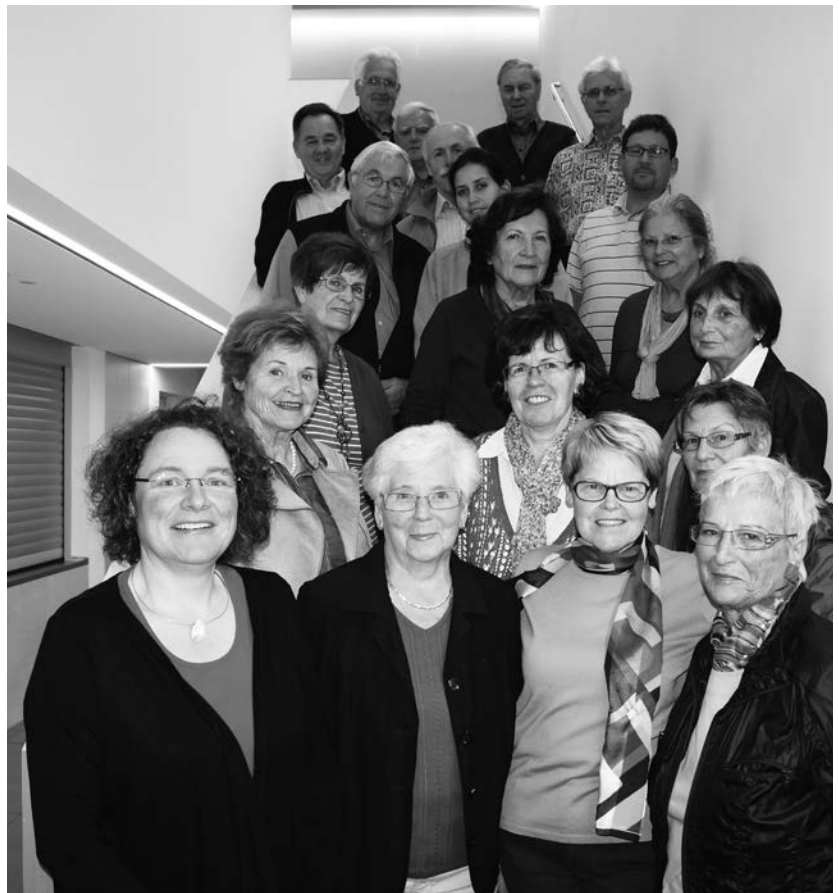
60 Jahre Kirchenchor Altenstadt